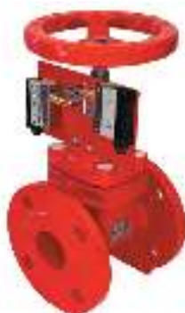
ТИП 47GV RED DN 50-300

Межфланцевый затвор для систем пожаротушения. Корпус окрашен в красный цвет