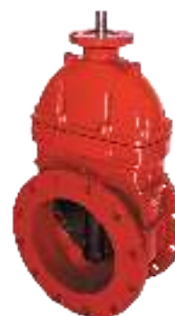
ТИП 47GVA RED DN 50-300

Задвижка клиновая фланцевая для систем пожаротушения. Корпус окрашен в красный цвет