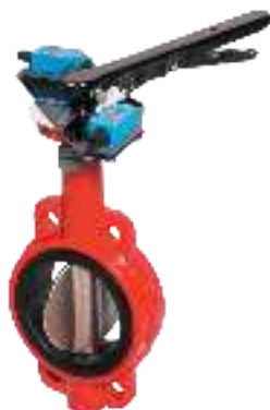
ТИП 017W RED DN 50-300

Межфланцевый затвор для систем пожаротушения. Корпус окрашен в красный цвет