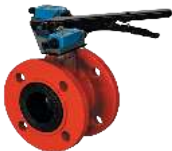
ТИП 021F RED DN 50-300

Задвижка клиновая фланцевая под электропривод для систем пожаротушения. Корпус окрашен в красный цвет