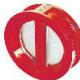
ТИП 010C RED DN 50-300

Фланцевый затвор для систем пожаротушения. Корпус окрашен в красный цвет